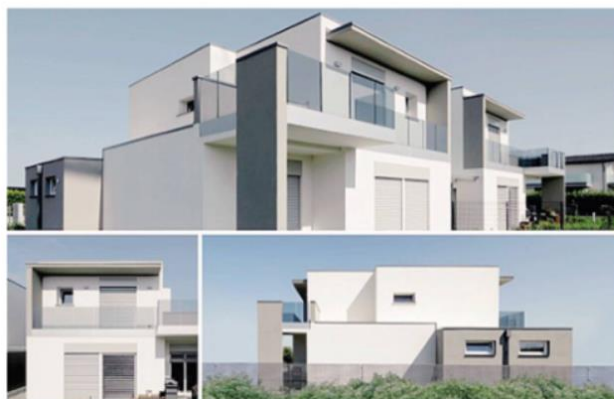
Un progetto residenziale della Ginvest

Un'offerta residenziale che incrocia le nuove esigenze abitative emerse dopo l'esperienza collettiva del lockdown, ma che si propongono sul mercato in un momento di grande incertezza economica. Sarà in grado una società in crescente difficoltà di assorbire le nuove pro-